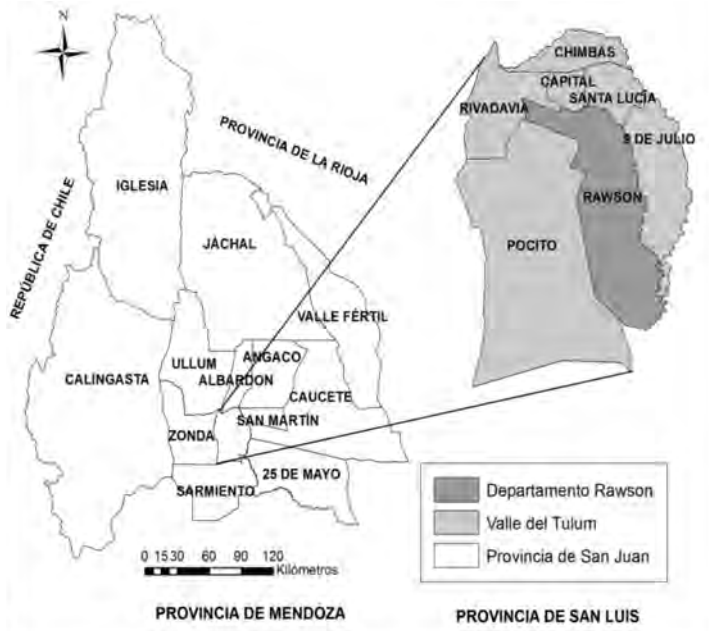
Figura 1: Departamento Rawson en la Provincia de San Juan.

La fig.1 representa la localización del departamento Rawson en el Valle del Tulum, provincia de San Juan. En la fig. 2 se localiza el área de cobertura de los centros de salud que se corresponde con el área de estudio del presente trabajo.