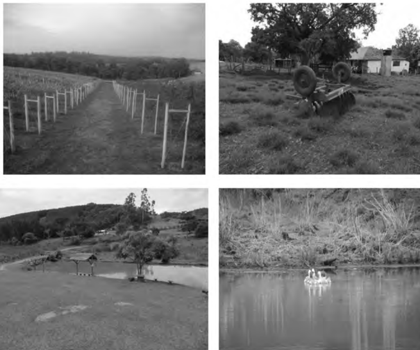
Figura 3: Aspectos de la paisaje de los Campos Gerais del Paraná

Más allá del cañón, el parque también cuenta con cascadas, rápidos, cuevas, inscripciones rupestres y el río Iapó que fluye a través del cañón. El número de visitantes es de aproximadamente 18.000 / año.