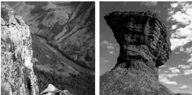
Figura 4: El Parque Guartelá- Río Iapó y El Parque Estadual Vila Velha – Taça.

A pesar del importante número de visitantes en los parques estatales, la investigación sobre la actividad de turismo rural en la región muestran que no están integrados con las propiedades rurales que desarrollan alguna actividad de turismo rural en la región, es decir, que no se utilizan como materia prima para la posibilidad de que el desarrollo del turismo rural regional. (KLOSTER, 2013) Los estudios realizados hasta la fecha sobre la actividad de turismo rural en el Campos Gerais se centraron en la microrregión (Ponta Grossa, Castro, Carambeí y Palmeira) con 22 propiedades que desarrollan alguna actividad turística. Busca analizarlos riesgos y el potencial de la actividad de turismo rural en las propiedades rurales de agricultores familiares.