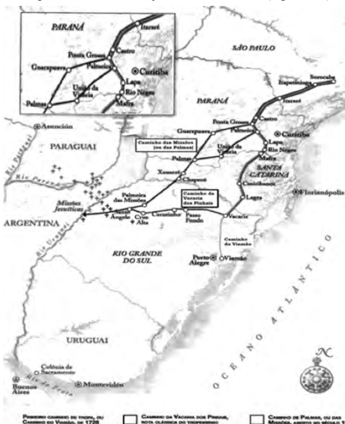
Figura 2: La ruta de los troperos en el sur de Brasil (Siglo XVIII).

O país foi receptáculo de um conjunto de políticas agrícolas que estimulou a concentração da terra e a marginalização econômica e social da agricultura familiar, a oligopolização da produção, o desemprego rural crescente, a dependência do país aos produtos agrícolas importados, a preferência para a produção de produtos de exportação como grãos e carne bovina e a compra de terras pelo capital estrangeiro. (KLOSTER & CUNHA. 2014, p. 70)