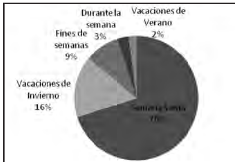
Figura N° 4. Período del año que llegan los turistas.