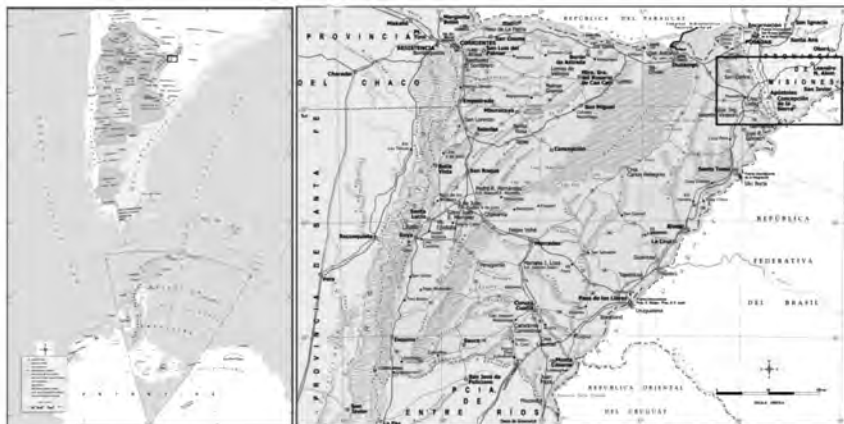
Figura N° 1 Área de estudios.