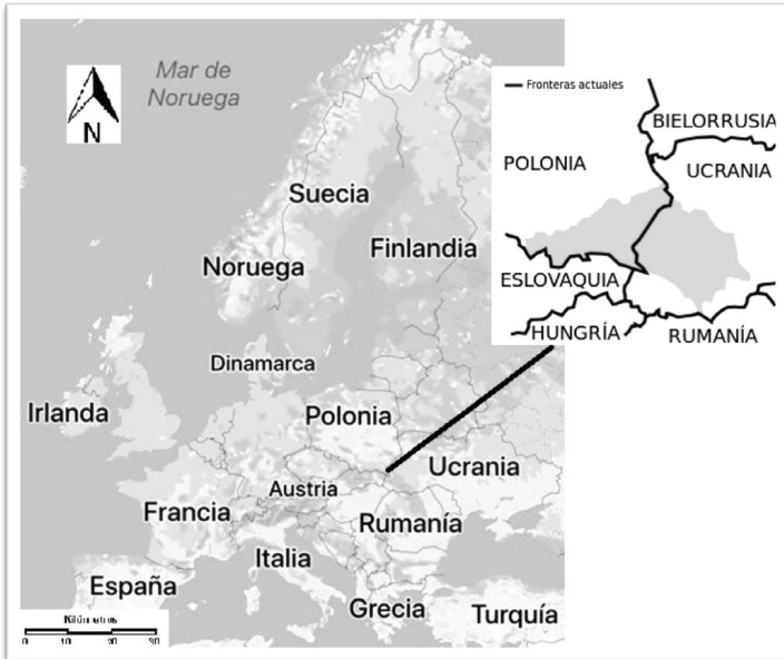
Mapa 1. Localización relativa de la región de Galitzia en Europa Oriental.