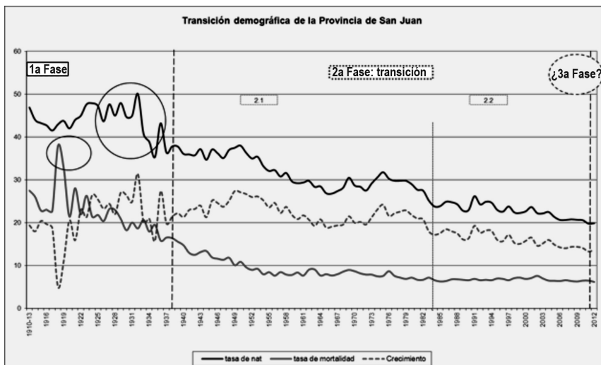
Figura 1: Transición demográfica de la provincia de San Juan.