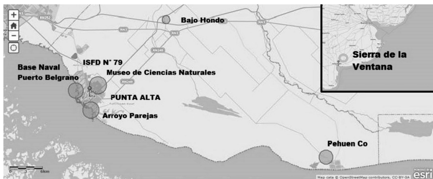
Figura. 1: Localidades en las que se realizaron trabajos de campo durante el Intercambio 2012 en Punta Alta y la Región.

Durante setiembre de 2012 la delegación misionera viajó –luego de un año de ardua gestión de los alumnos, docentes y directivos-, a Punta Alta compartiendo viajes de estudio, trabajos de campo y experiencias académicas con los receptores. Se recorrieron diferentes paisajes naturales y culturales (Arroyo Pareja, Pehuen Co, Base Naval Puerto Belgrano, zona agraria de Bajo Hondo), así como también el paisaje urbano de la ciudad de Punta Alta, guiados por profesores universitarios especialistas en cada localización. Además se concretaron distintos circuitos culturales en los museos de la ciudad como el Archivo Histórico Municipal, el Museo de Ciencias Naturales “Charles Darwin” y el Museo de la Base Naval Puerto Belgrano. También se llevó a cabo un intercambio académico con ponencias de biólogos, historiadores, geógrafos de la localidad y la región y de alumnos de los últimos años de ambas carreras.