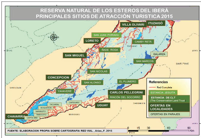
Fig. 3: Reserva Natural de los Esteros del Iberá. Principales sitios de atracción turística, 2015

sala de primero auxilios, teléfono público, sanitarios, agua potable, lugar de alojamiento y de comidas.