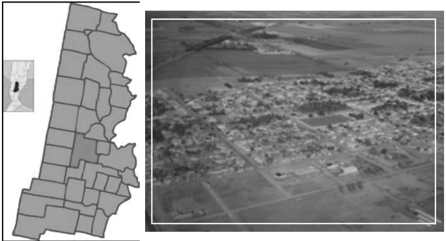
Fig. 1. Ubicación de Humboldt en el Departamento Las Colonias, en la provincia de Santa Fe. Derecha Vista aérea de Humboldt.

Durante el siglo XIX dada la gran extensión de nuestras pampas y su escasa densidad demográfica se instala en nuestro país el proyecto de fomentar la inmigración con población europea a fin de colonizar vastas extensiones de tierra mediante el trabajo rural.