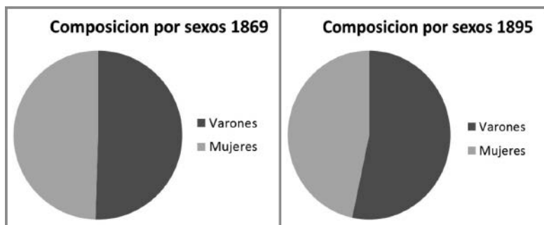
Fig. 3. Variación de la composición por sexos de la población de la colonia Humboldt entre 1869 y 1895. Fuente de datos: (Argentina, 1872 y 1898).