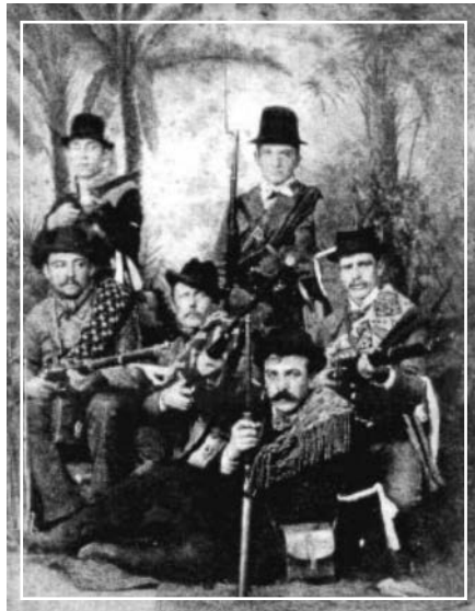
Fig. 6. Revolucionarios de Esperanza que participaron en el levantamiento armado, en 1893. (Rey 2009).

a Humboldt se le agregaron las colonias vecinas San Jerónimo, Josefina, Santa Clara y Santa María, pero también en San Carlos, Las Tunas, Clucellas, etc., por otro lado Esperanza y la muy pujante Rafaela comenzaron a ser un no desdeñable centro de oposición al Gobierno. (Gallo 2007)