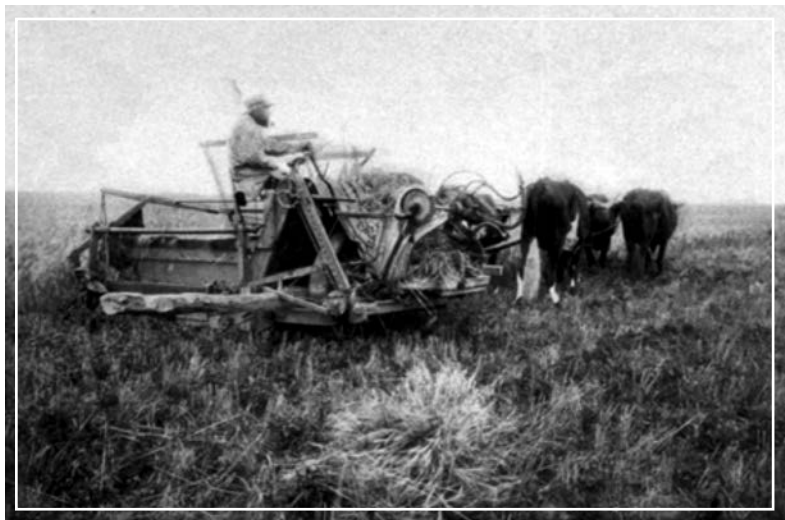
Fig. 7. Agricultor trabajando con una cosechadora que también ataba las gavillas. Colonia Humboldt, provincia de Santa Fe, Foto Ernesto Schlie, 1889. Fuente: Collado (2011).

armas pero hubo muchos más involucrados, ya que se ocuparon varias localidades. Recordemos que los colonos suizo alemanes de Esperanza, San Jerónimo y San Carlos eran expertos tiradores famosos por su excelente puntería (Fig. 6).