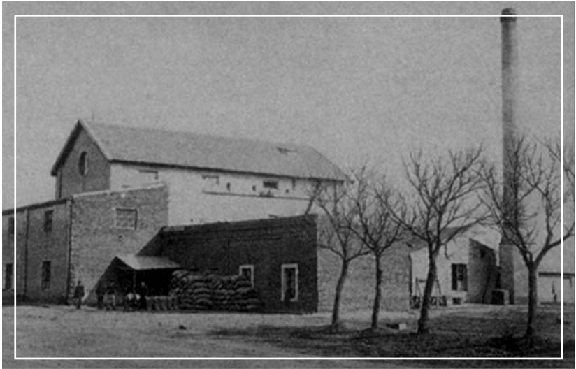
Fig. 8. Molino Milesi, Colonia Humboldt, provincia de Santa Fe. Foto: Ernesto Schlie, 1889. Fuente: Collado (2011).

Durante 1882 comienza a funcionar en el pueblo un molino a vapor propiedad de la familia Milesi, del cual se obtenían 100 bolsas de harina por día ocupando 10 hombres y 25 caballos para la fuerza motriz de la máquina. Ya para 1893 podía producir en 24 horas, 22.500 kg de harina. El edificio tenía dos pisos con caldera y máquinas para triturar el trigo. (Fig. 8), que mediante un embudo se lo repartía en compartimientos donde quedaba en depósito hasta la molienda. El proceso era automático impulsado por un motor central donde el trigo entraba como grano y salía como harina sin ser tocado por el operario. Tenía un sistema austrohúngaro de cilindros metálicos en el que, al cambiar las superficies de los rodillos, la harina aumentaba su rendimiento y mejoraba su calidad. La chimenea, de 25 m de altura, estaba rodeada de depósitos de agua de 10.000 litros extraída con baldes de un pozo de agua, izados y bajados por la acción de un caballo (Krohling, 2013).