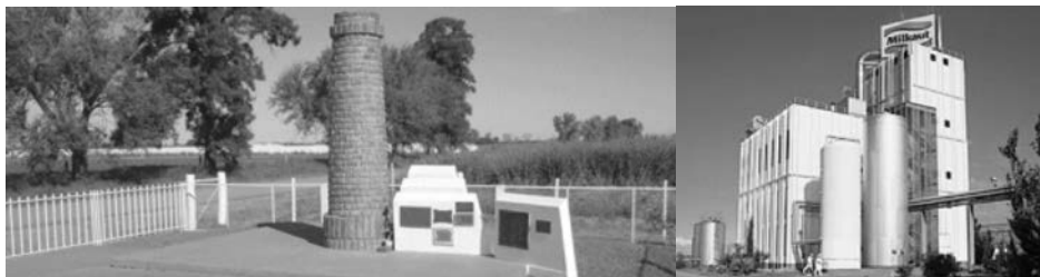
Fig. 9. Monumento en homenaje a la Sociedad Cooperativa Limitada de Cremería “Unión La Nueva”. Su fundador y único presidente fue Valentín König, quien comenzó a industrializar la crema allí obtenida. Fuente: El Santafesino (2011). Derecha: Instalaciones de la planta industrial Franck (Milkaut, 2014).

En 1961, en la cercana Colonia Nueva se abrió una planta elaboradora de quesos de pasta dura y semidura (planta de Colonia Nueva) con lo cual la población de Humboldt vislumbró un nuevo futuro laboral con puestos de trabajo que subsisten hasta la fecha. Situada a 6 km del centro de Humboldt, de las 140 personas que forman su plantel de operarios, 94 pertenecen a la localidad y el resto llega de los pueblos vecinos como Nuevo Torino, Felicia, Pilar y Esperanza. Sus instalaciones cuentan con las normas y códigos vigentes de higiene, saneamiento, tratamiento de efluentes y disposiciones vigentes a nivel mundial (observación directa). En el predio de 600 m 2 se procesan 230.000 litros de leche provenientes de tambos vecinos. También posee una planta elaboradora de lactosa y concentrado de proteínas de suero de queso (WPC) única en Sudamérica. Funciona además una de las pocas plantas de concentrados de proteínas de leche (MPC) que existen en el mundo. También tiene planta productora de alimentos balanceados para bovinos y porcinos destinados a los socios de la institución. La gran producción quesera es enviada a países de Europa, Asia, América Latina y Estados Unidos, coordinada desde la central del grupo lácteo ubicada en Franck.