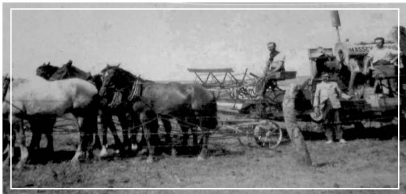
Fig. 5. Implementos agrícolas de la época. Humboldt circa 1880.

Entre las herramientas de esa época se distinguen los arados de una reja o de “mancera” tirados por caballos o yuntas de bueyes para el laboreo de las tierras. Más tarde fueron necesarios el arado de tres rejas, segadoras y trilladores (Figs. 5 y 7).