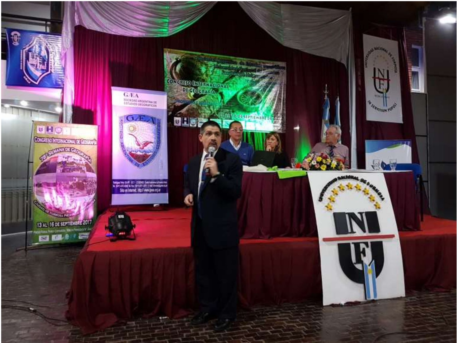
Exposición en las Comisiones temáticas