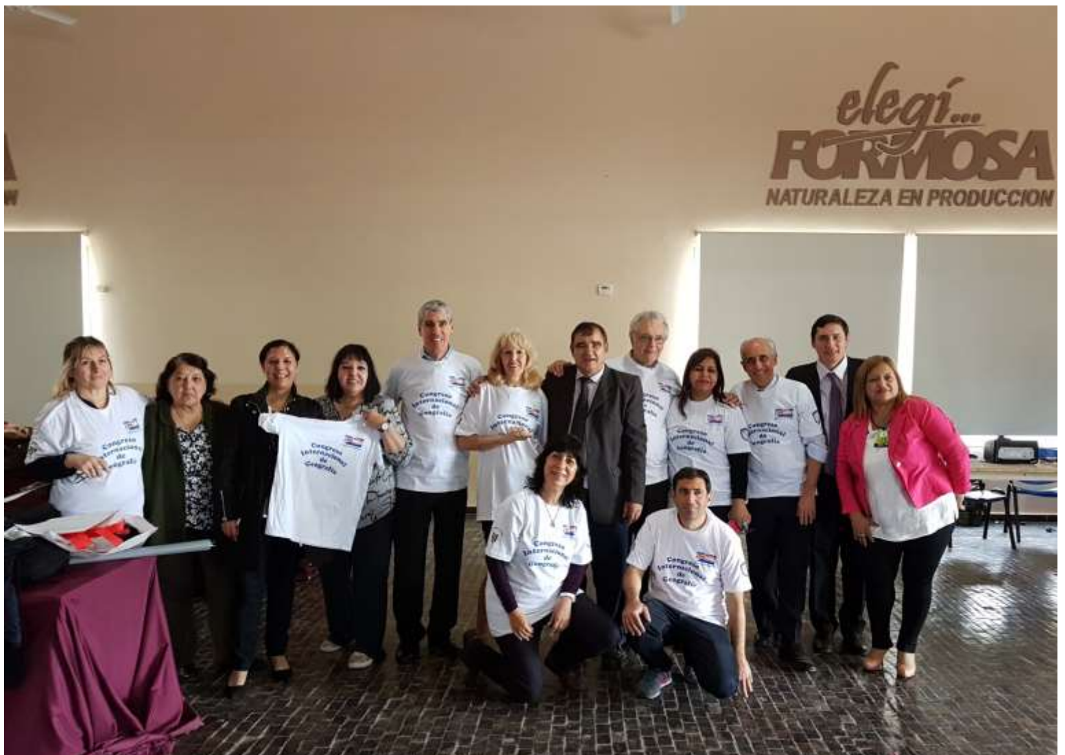
Al finalizar el Congreso