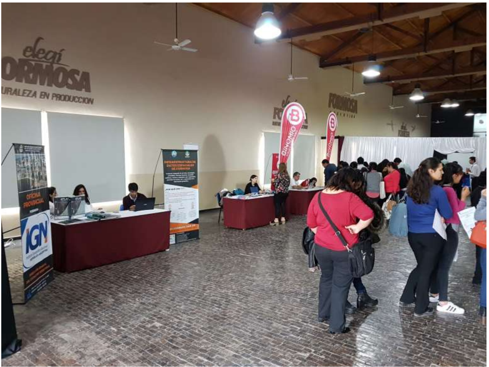
Ingreso al Congreso