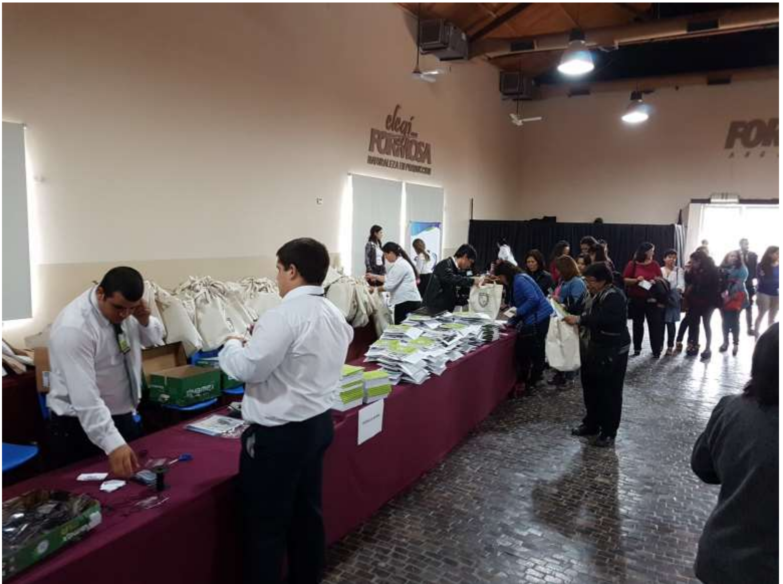
Entrega de material del Congreso