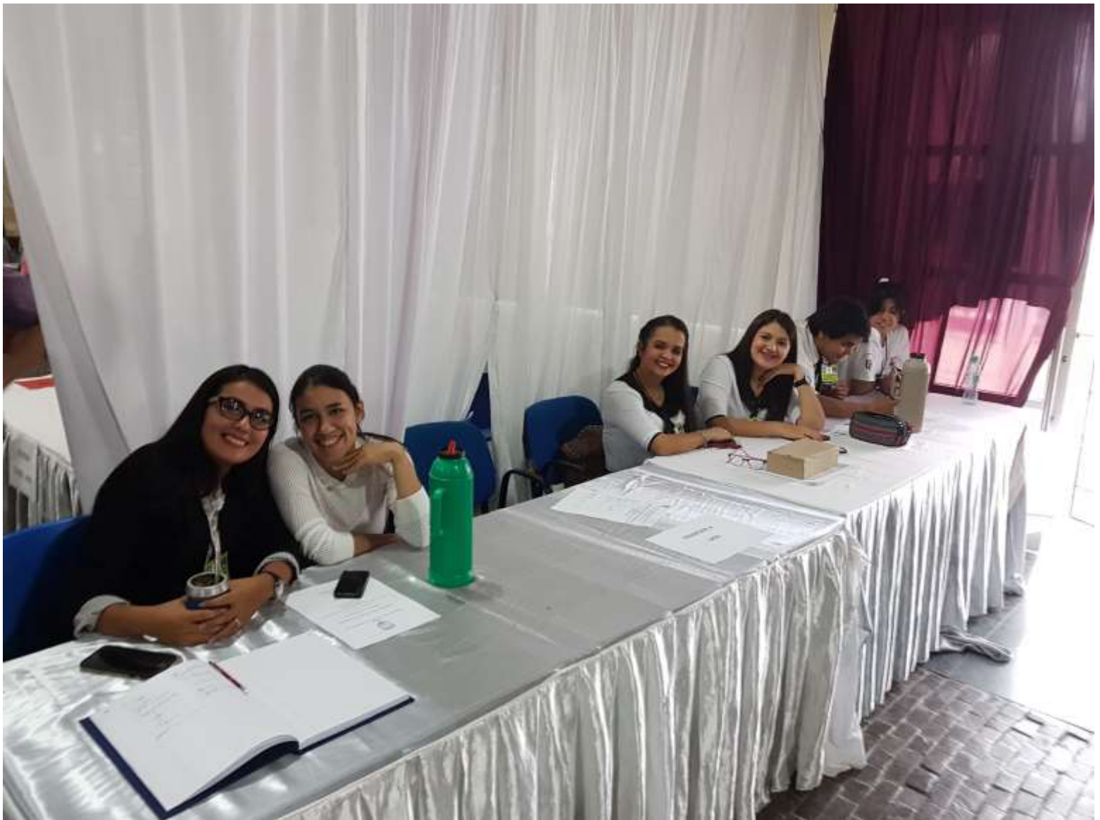
Ingreso al Congreso