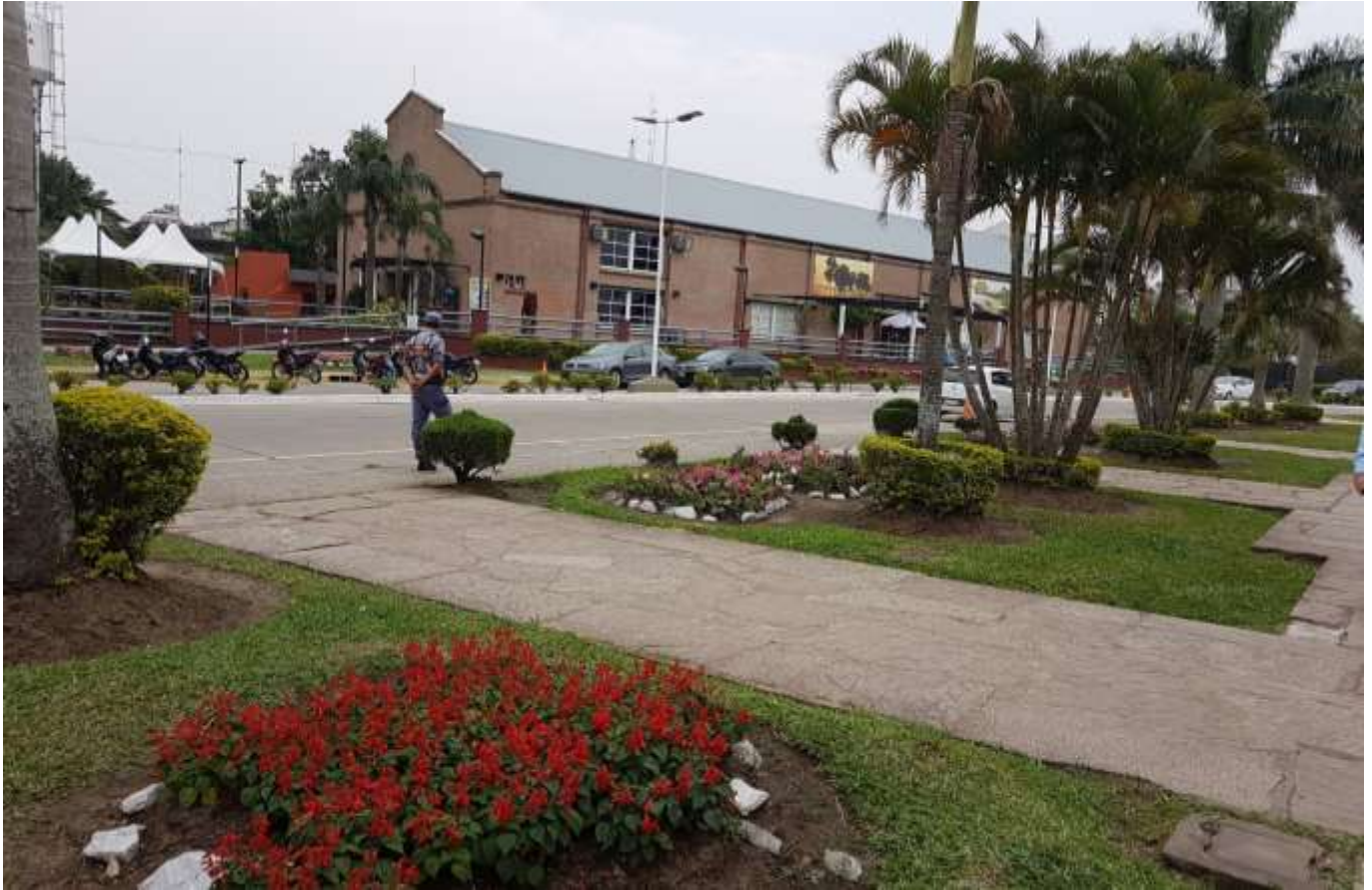
Lugar de realización del Congreso

Predio Ferial Paseo Costanera Vuelta Fermoza s/n°. Galpón "G" Ciudad de Formosa Provincia de Formosa, República Argentina.