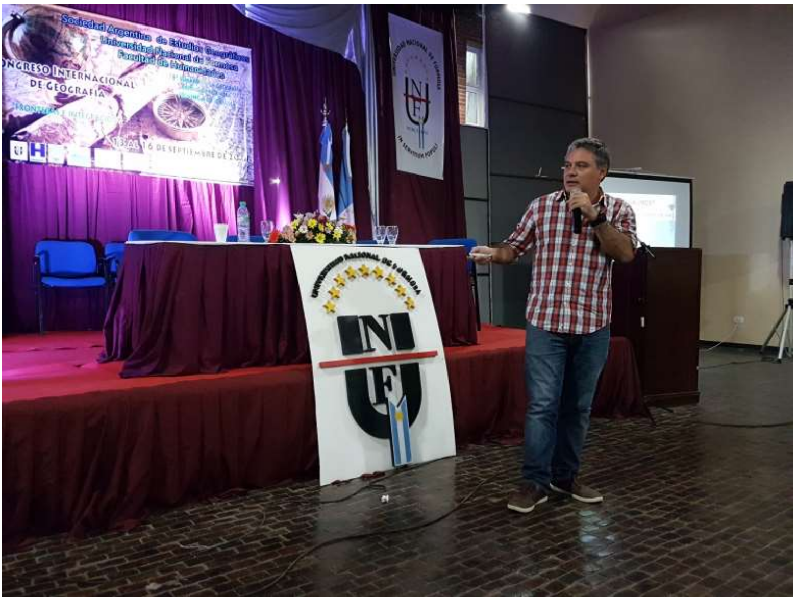
Explicación del Viaje de estudio