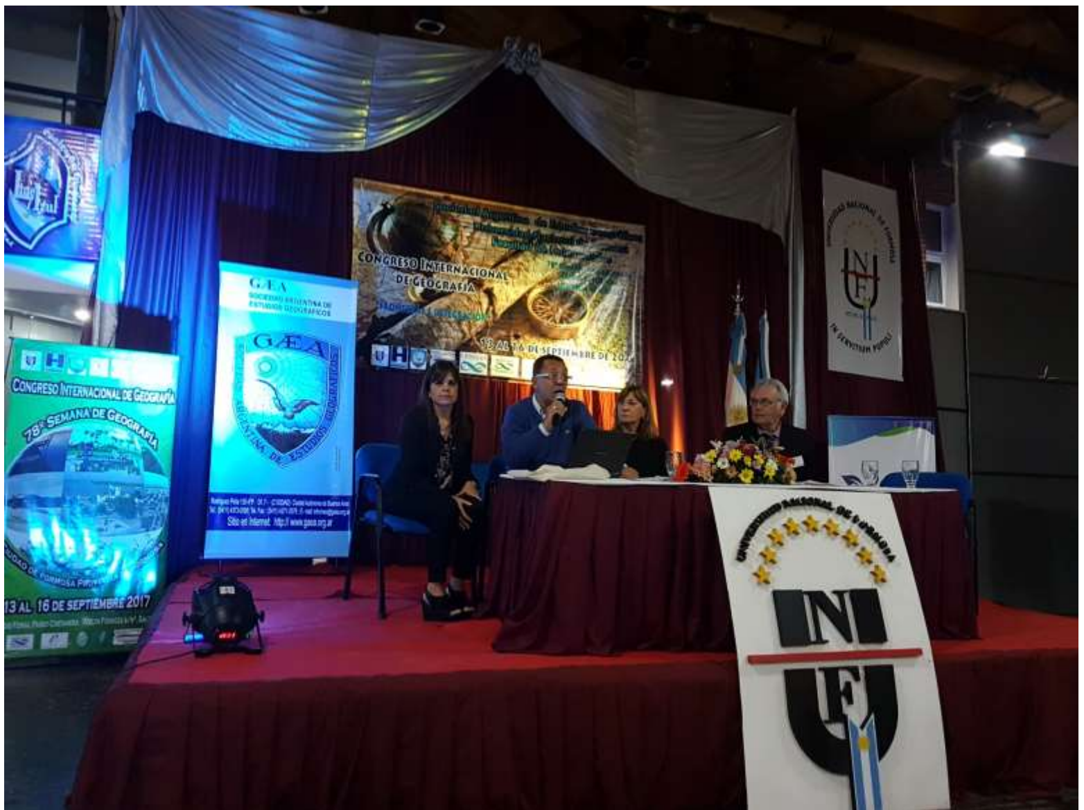
Exposición en las Comisiones temáticas