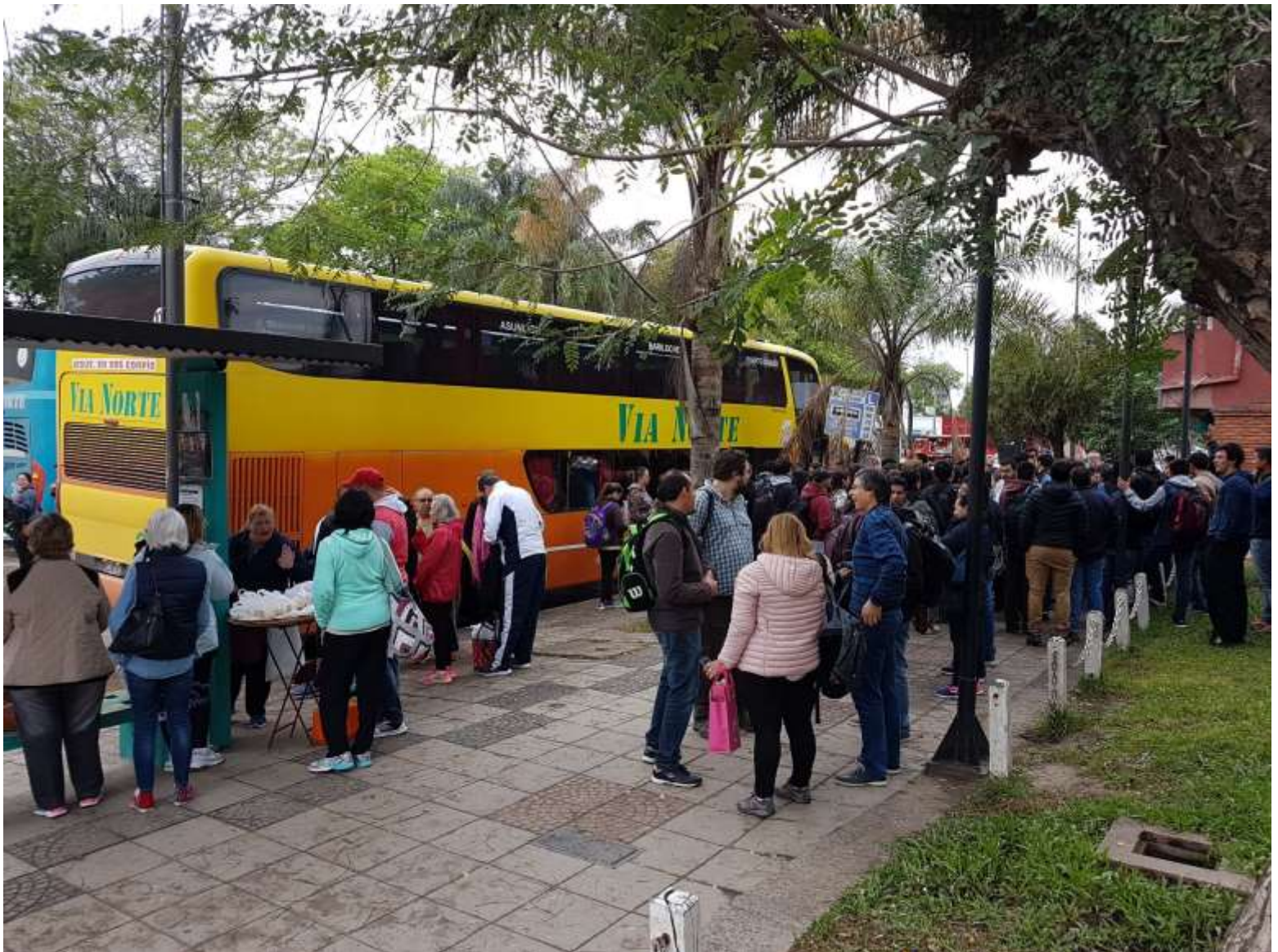
Salida para Herradura