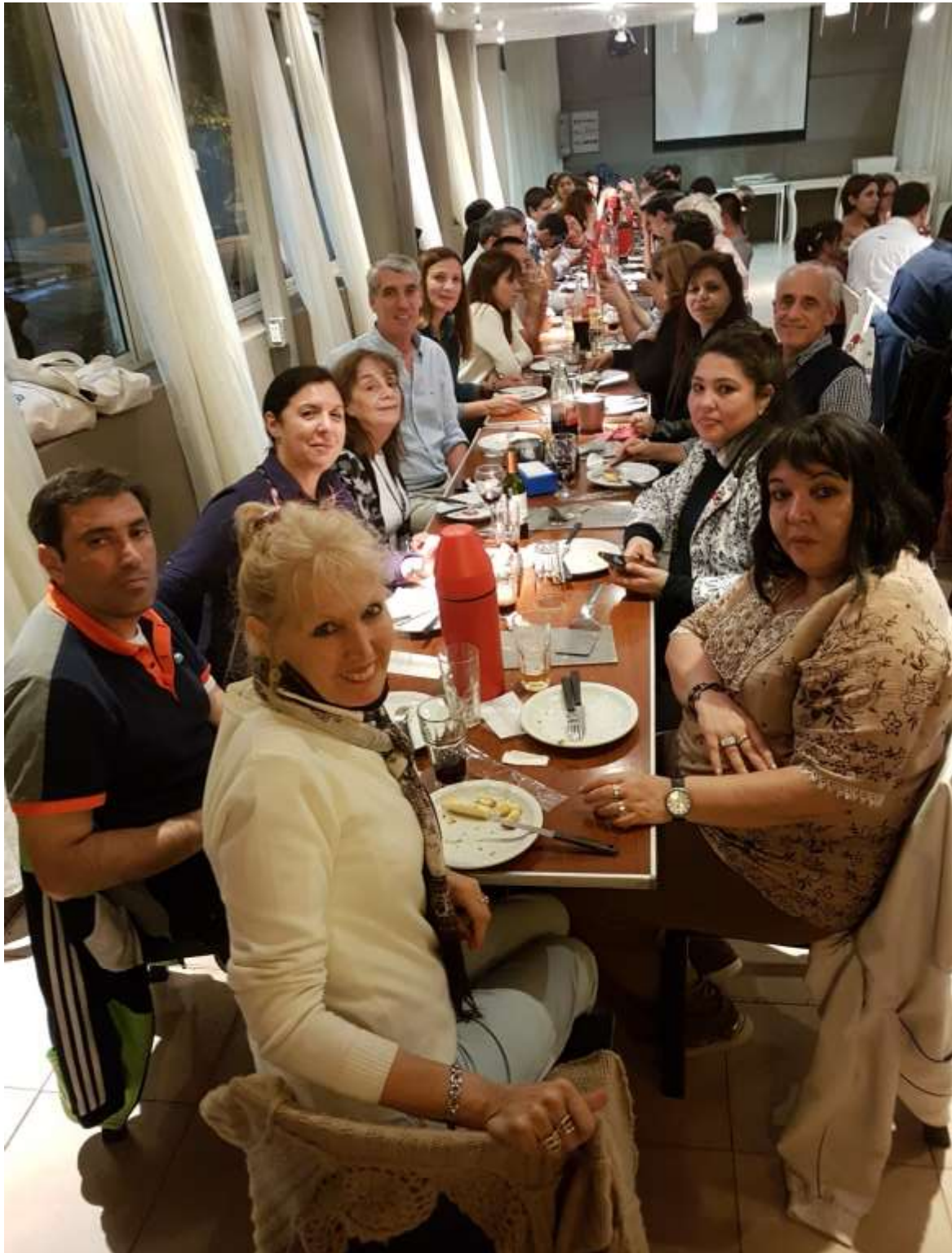
Participantes del Congreso cenando en Formosa