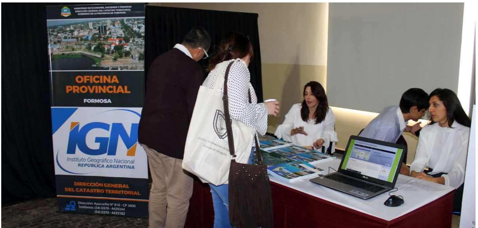
Stand del Instituto Geográfico Nacional