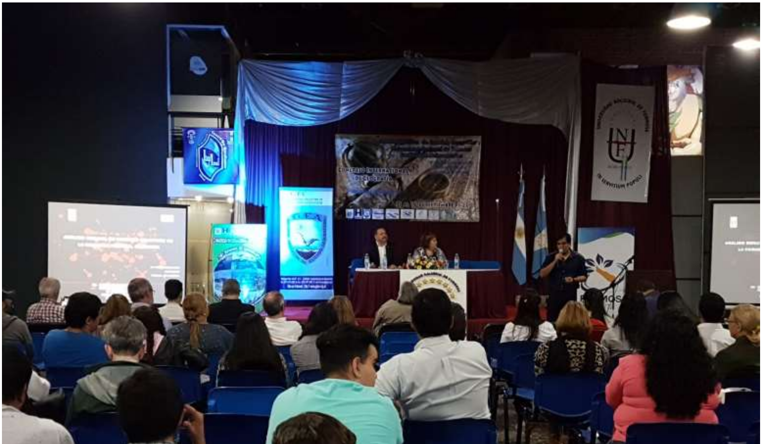
Exposición en las Comisiones temáticas