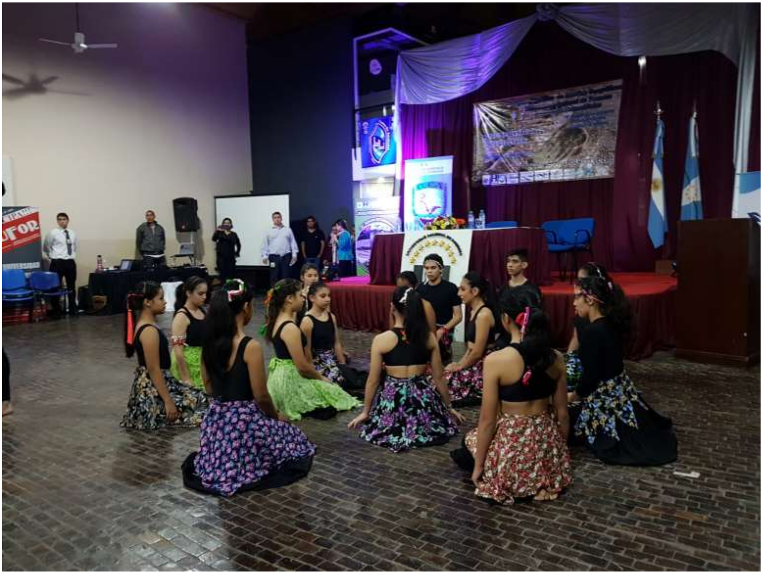
Actuación del Ballet de Danzas Contemporáneas de la E.P.E.S. n°52. Centro Polivalente de Arte “Monona Donkin”