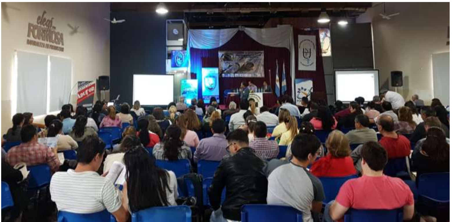
Exposición en las Comisiones temáticas