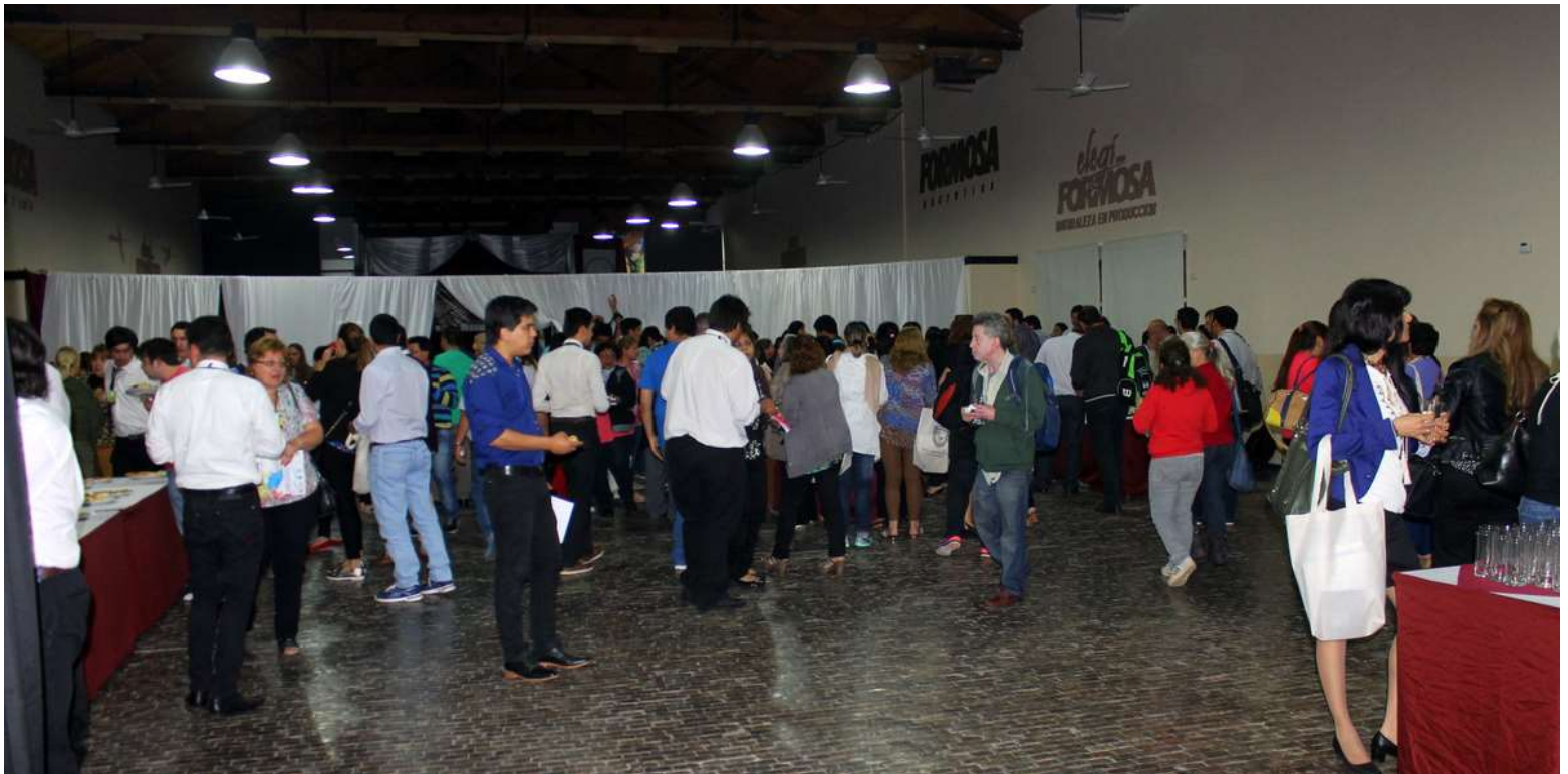
Vino de Honor