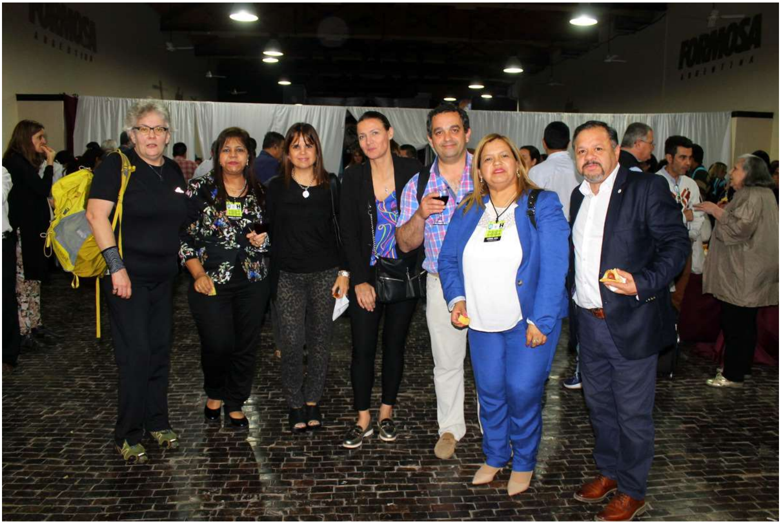
Profesores de Formosa, Misiones y San Juan