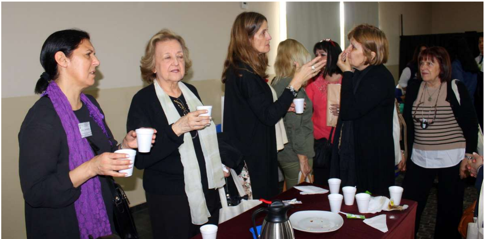
Profesoras de Bs. As. y Santa Fe