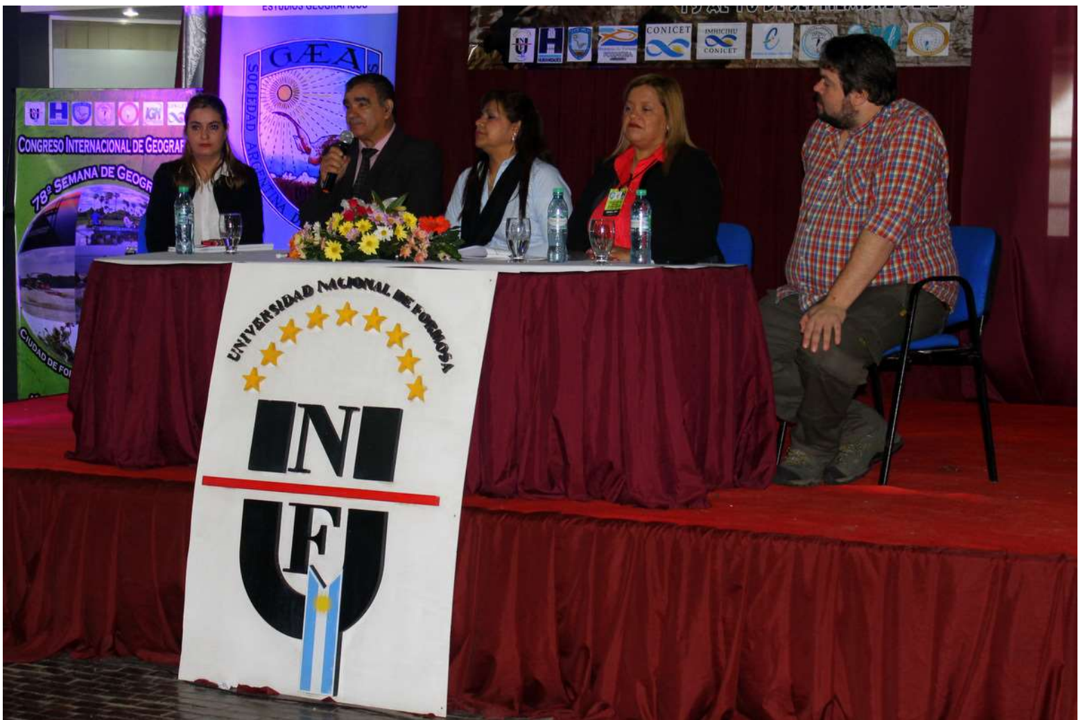
Exposición en las Comisiones temáticas