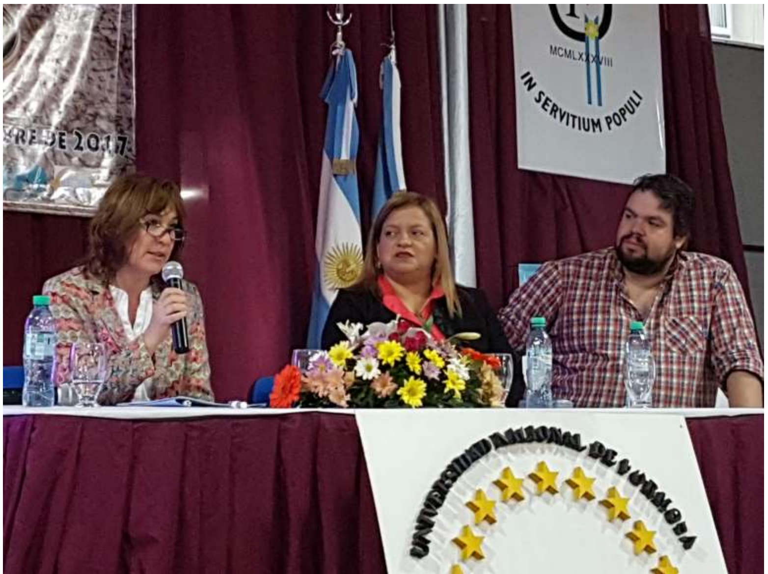
Exposición en las Comisiones temáticas