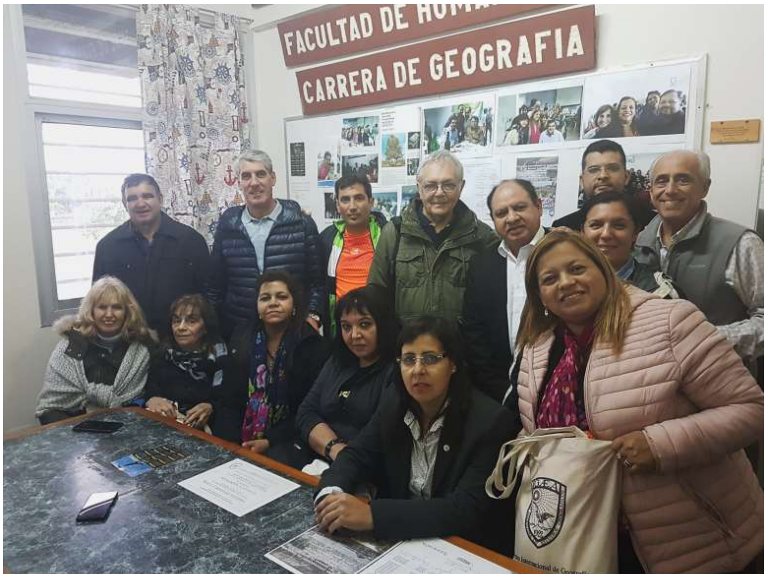
Visita a la Universidad Nacional de Formosa La Comisión Organizadora junto al Decano, Vicedecana, Director de la Carrera de Geografía y docentes