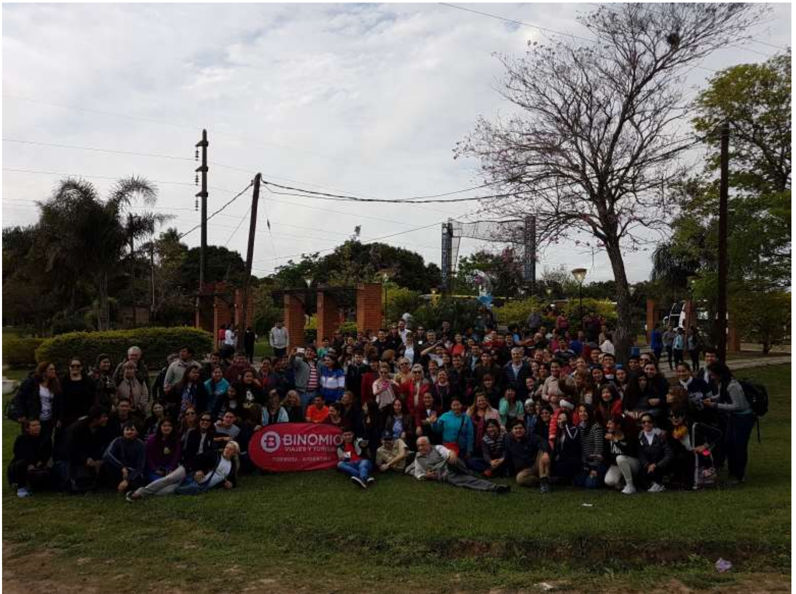
Participantes del Congreso en Herradura