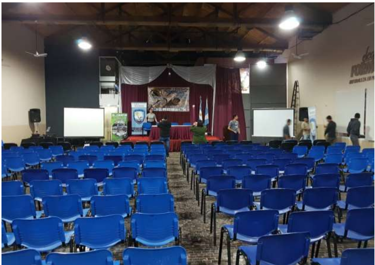
Los preparativos del Congreso