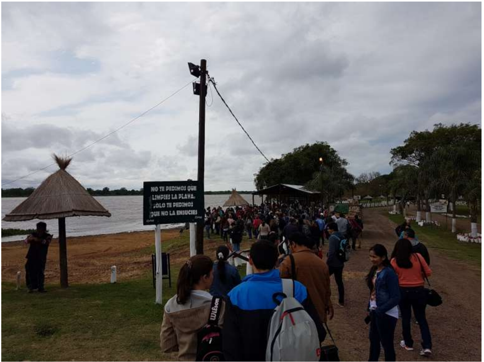
El intendente de Herradura da la bienvenida a los participantes del Congreso y hace entrega de la declaratoria de Interés