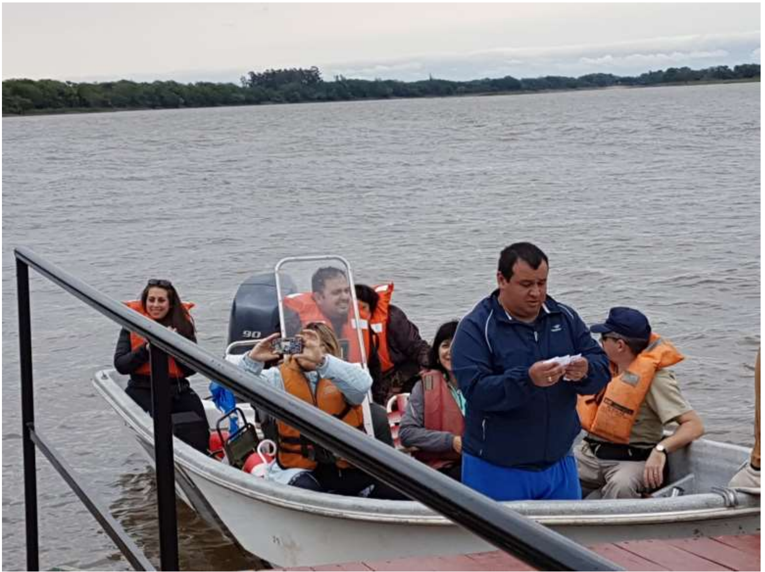
Navegación por la laguna Herradura