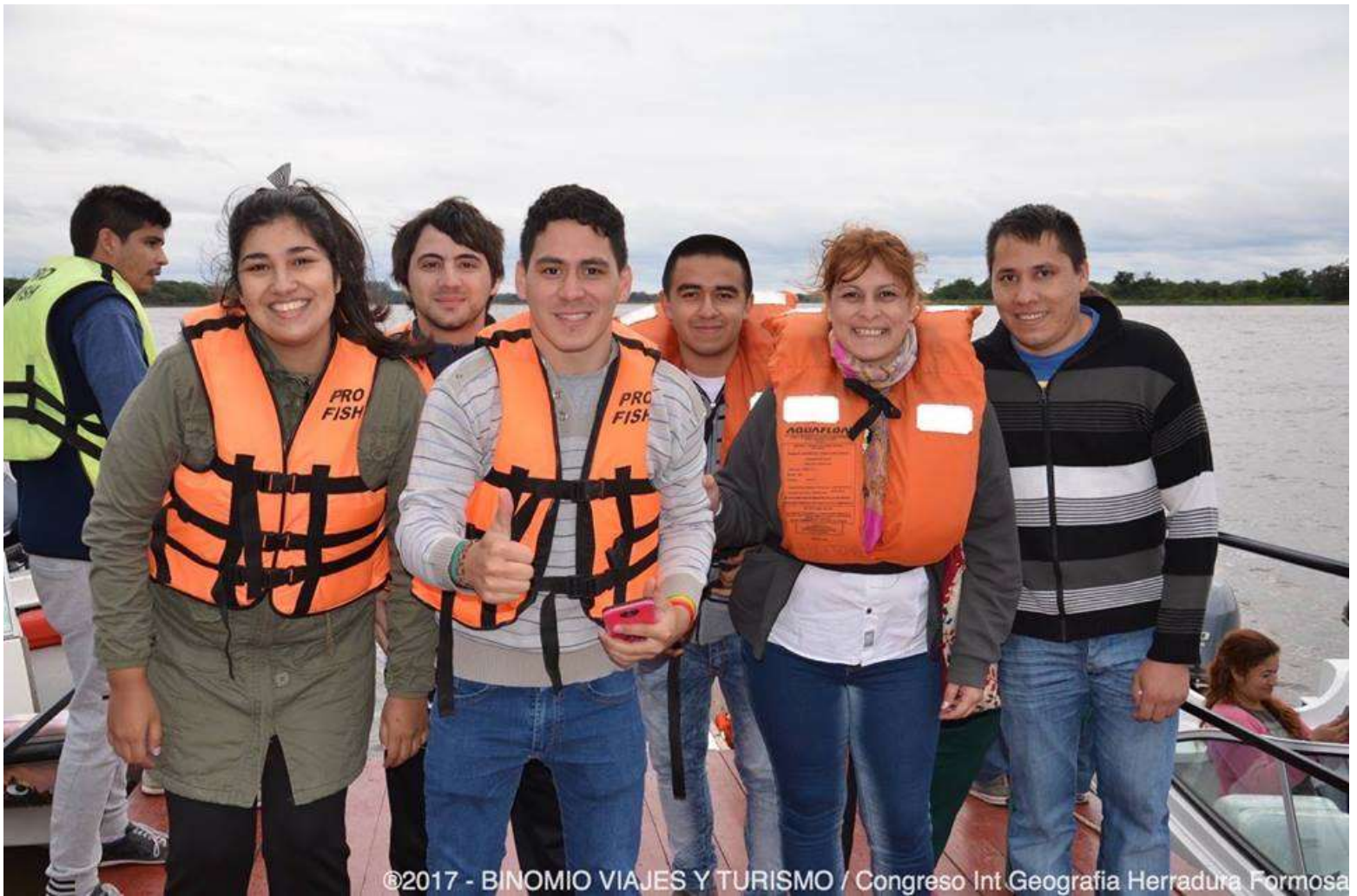
Preparativos para la Navegación por la laguna Herradura