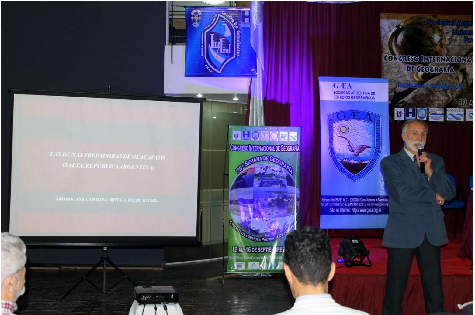
Exposición en las Comisiones temáticas