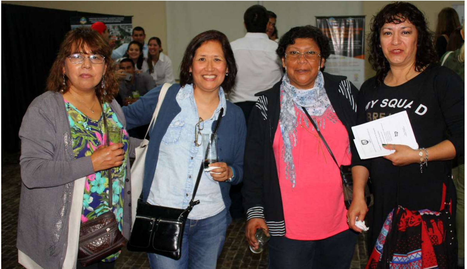
Profesoras de Jujuy