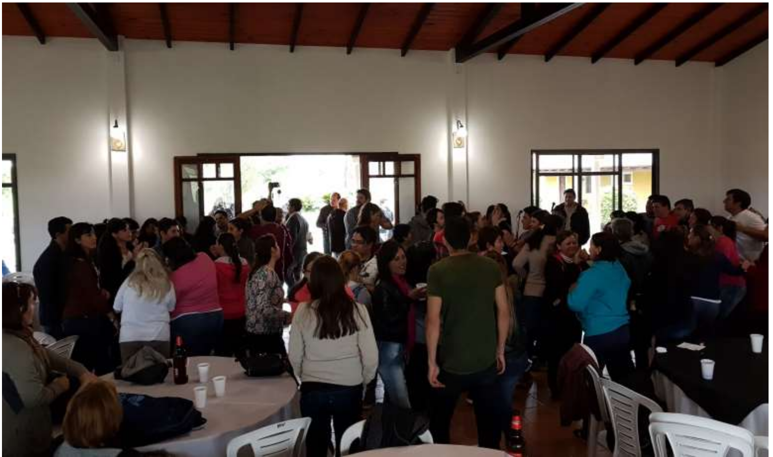
Almuerzo con actuación artística y baile