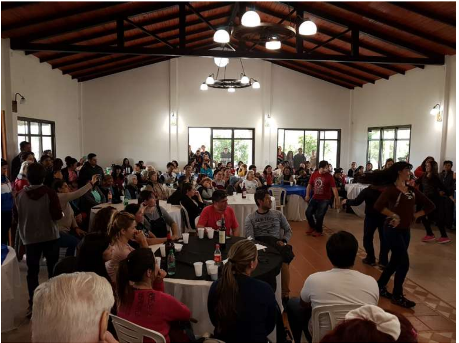
Almuerzo con actuación artística y baile