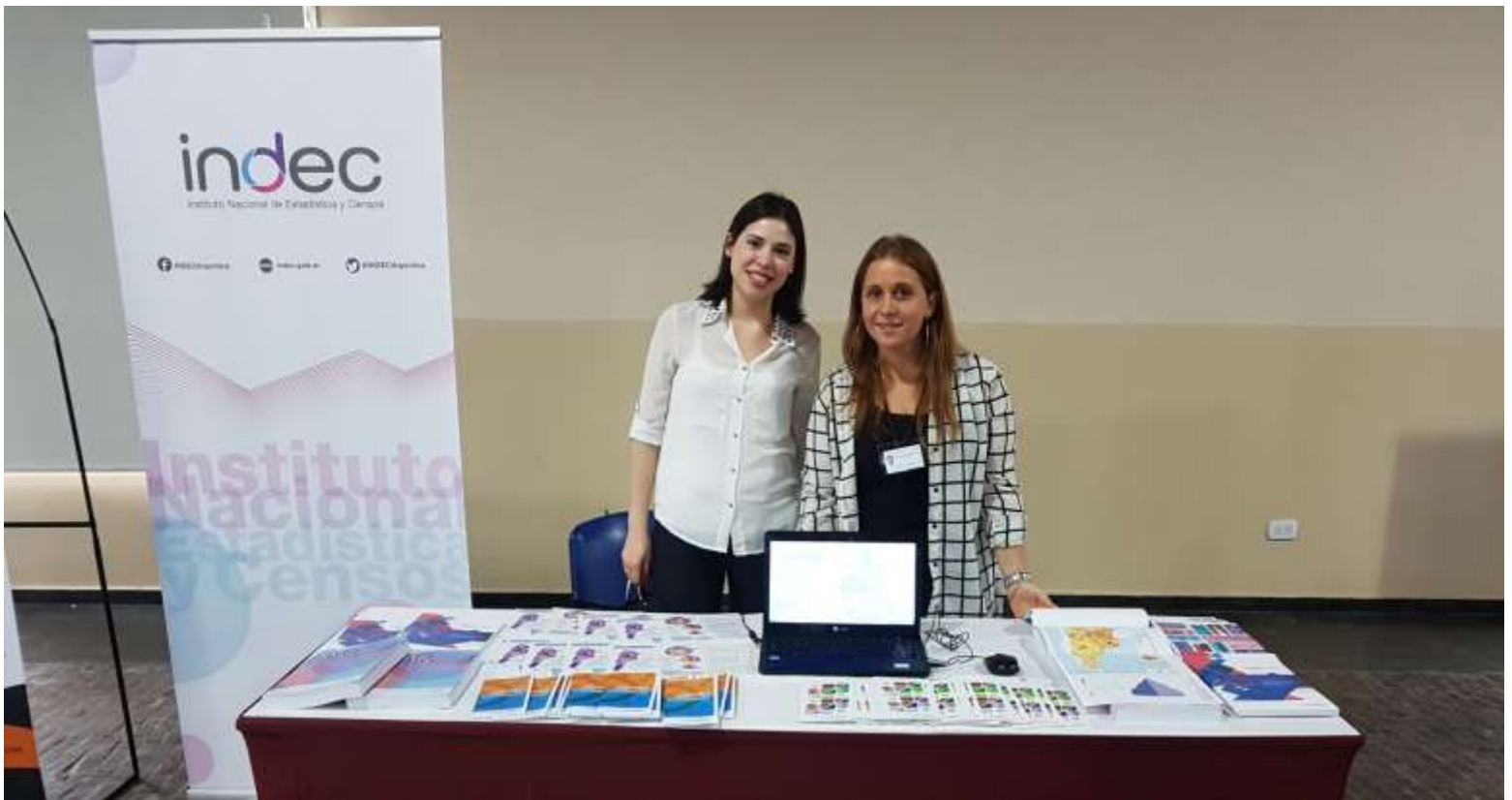
Stand del INDEC