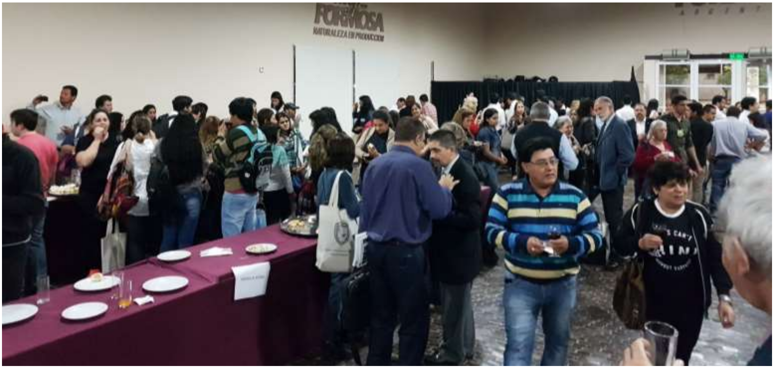
Vino de Honor