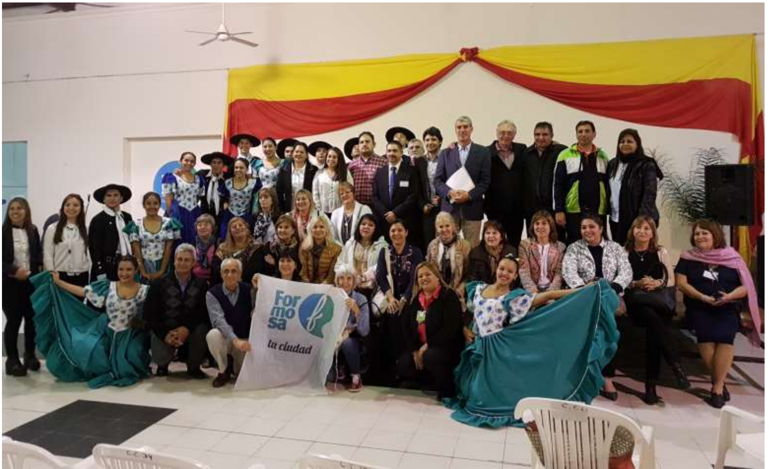
Danzas Folklóricas en la Municipalidad de Formosa