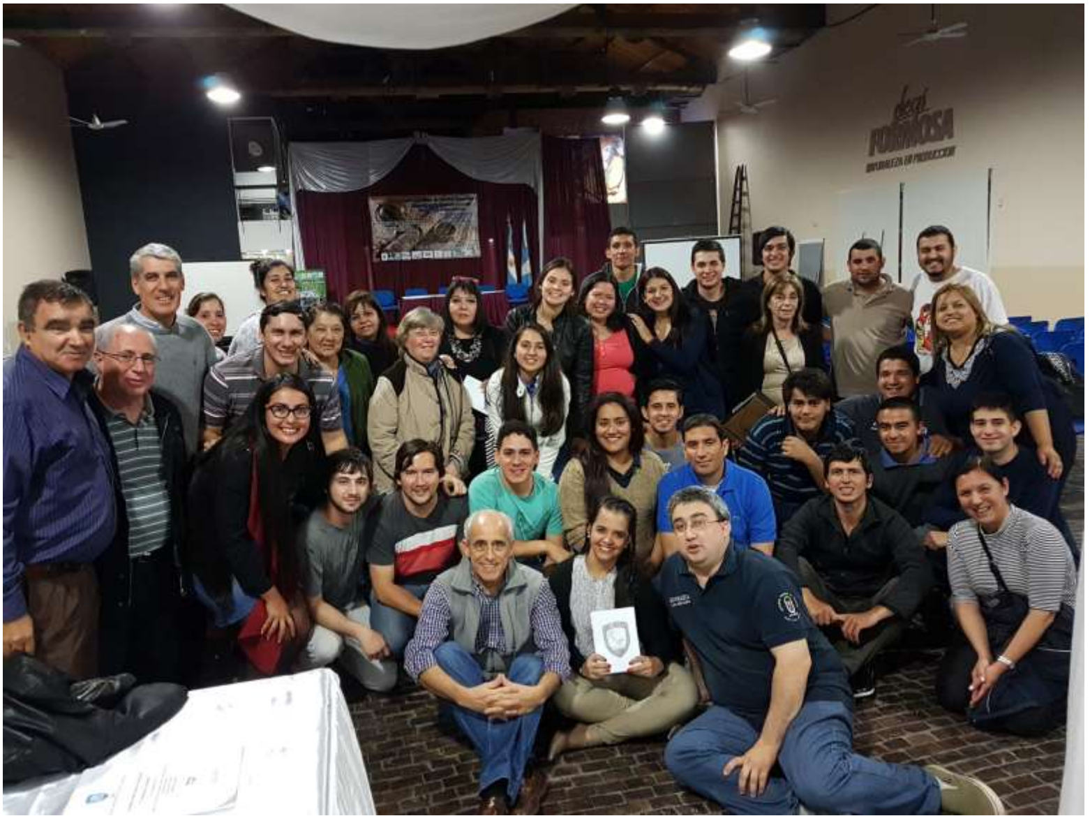
Comisión organizadora, docentes y alumnos colaboradores del Congreso