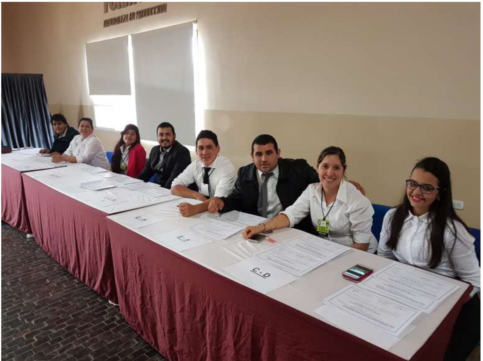
Entrega de Certificados