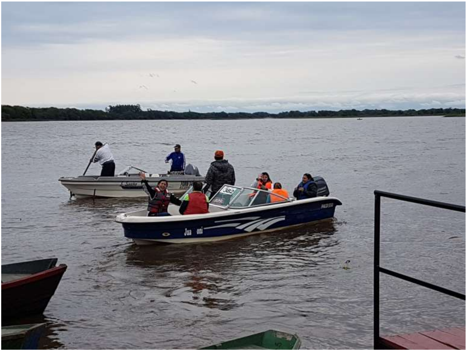
Navegación por la laguna Herradura