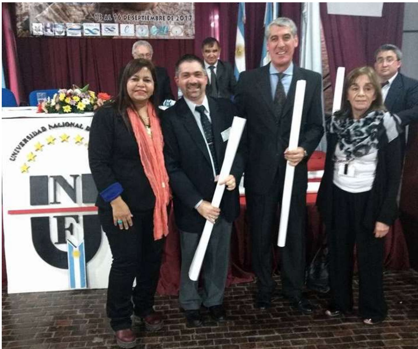
Entrega de mapas, publicaciones y recordatorios