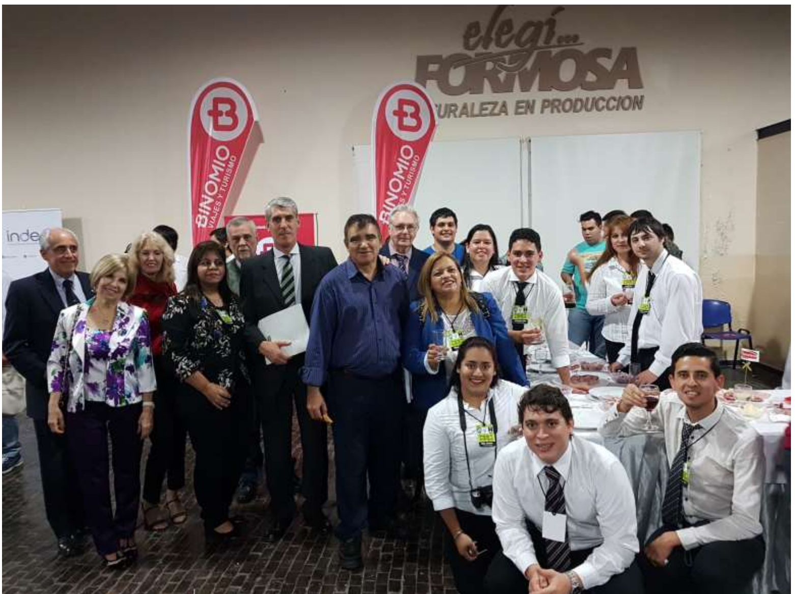
Docentes y alumnos de Formosa, expositores de Paraguay e integrantes de la Comisión Organizadora