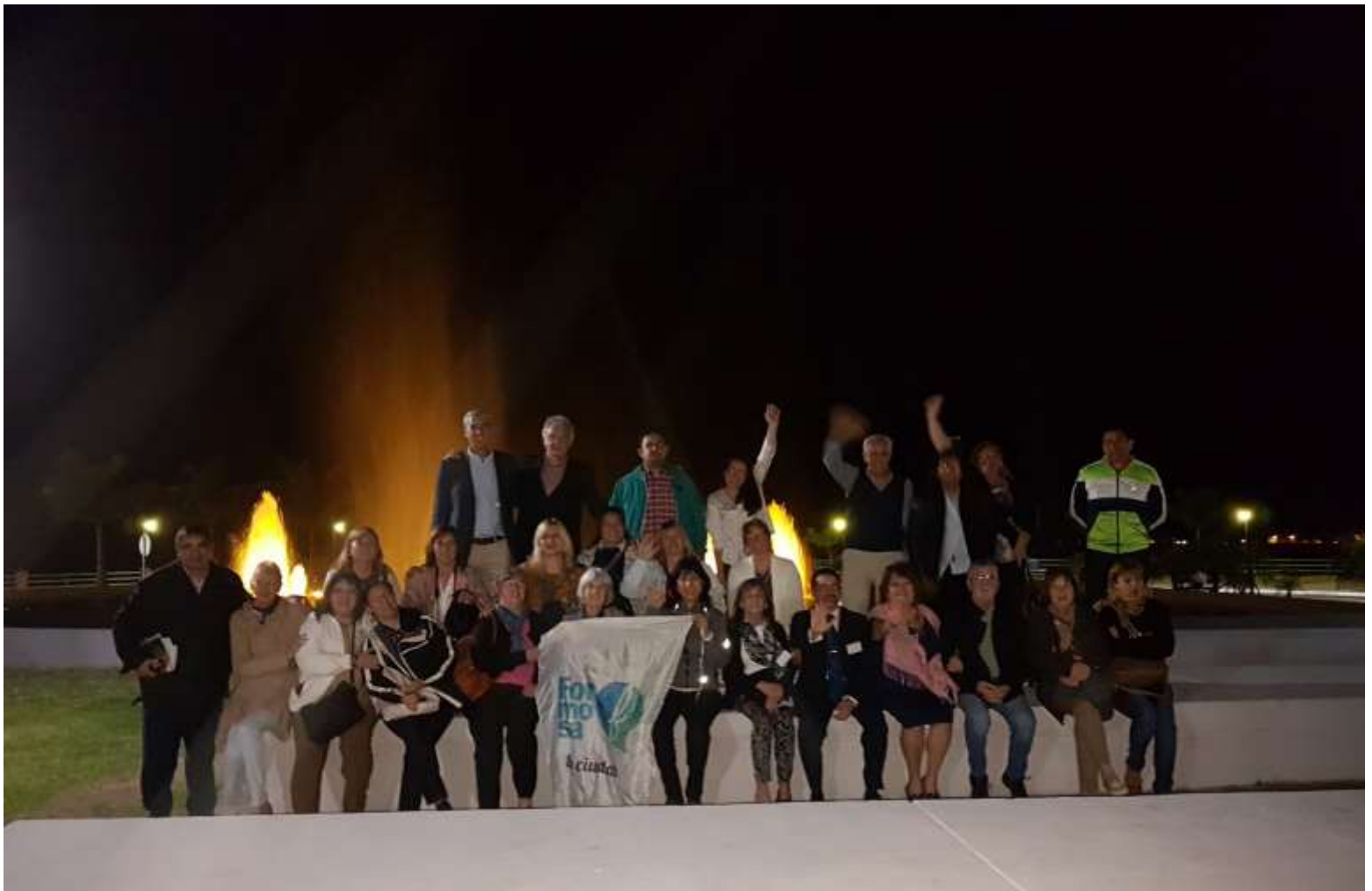
La noche en Formosa