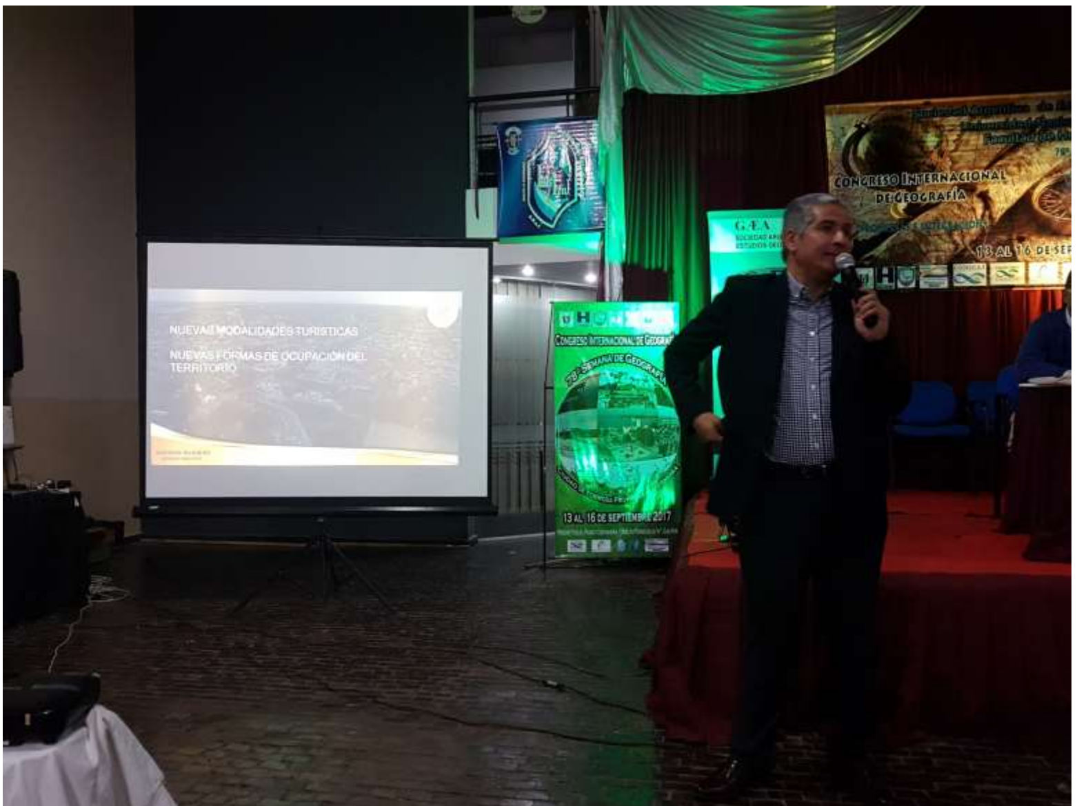
Exposición en las Comisiones temáticas