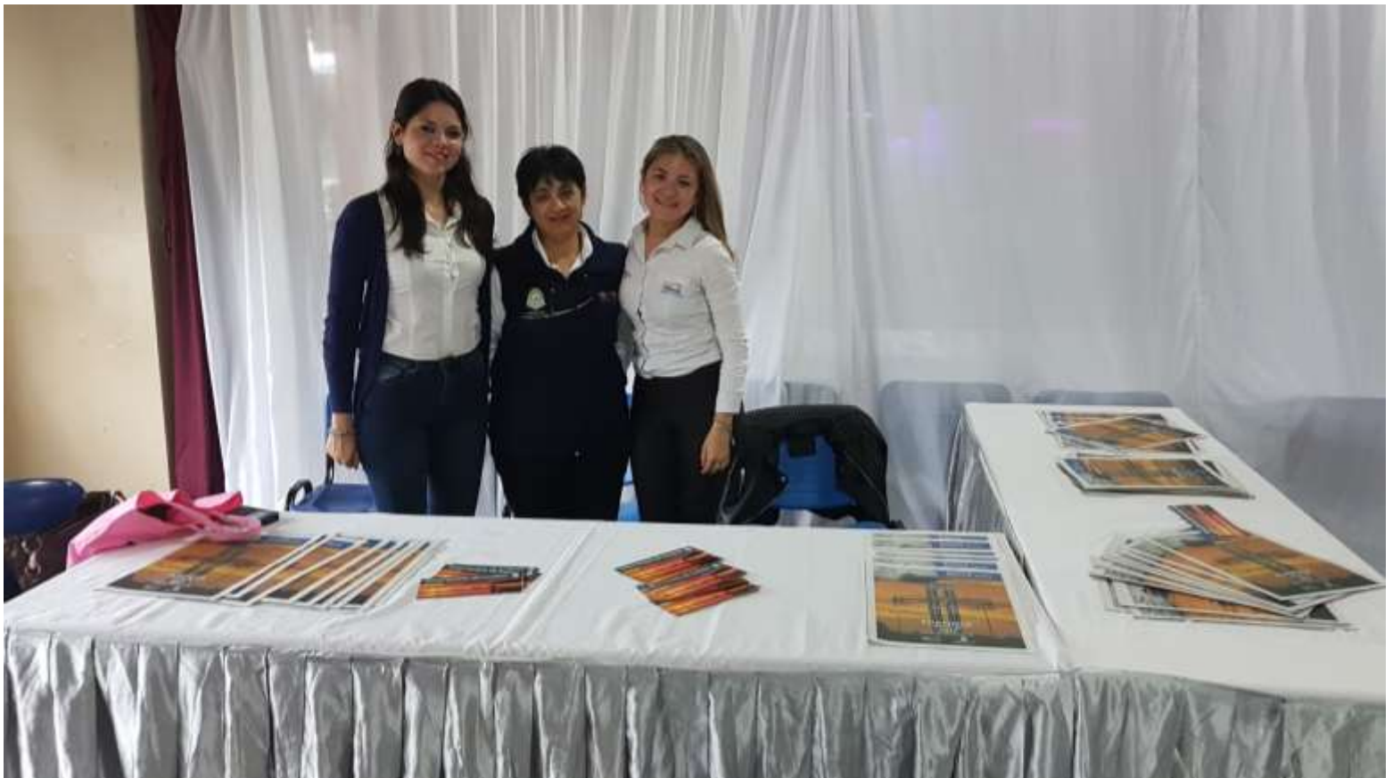
Stand del Ministerio de Turismo de la Provincia de Formosa