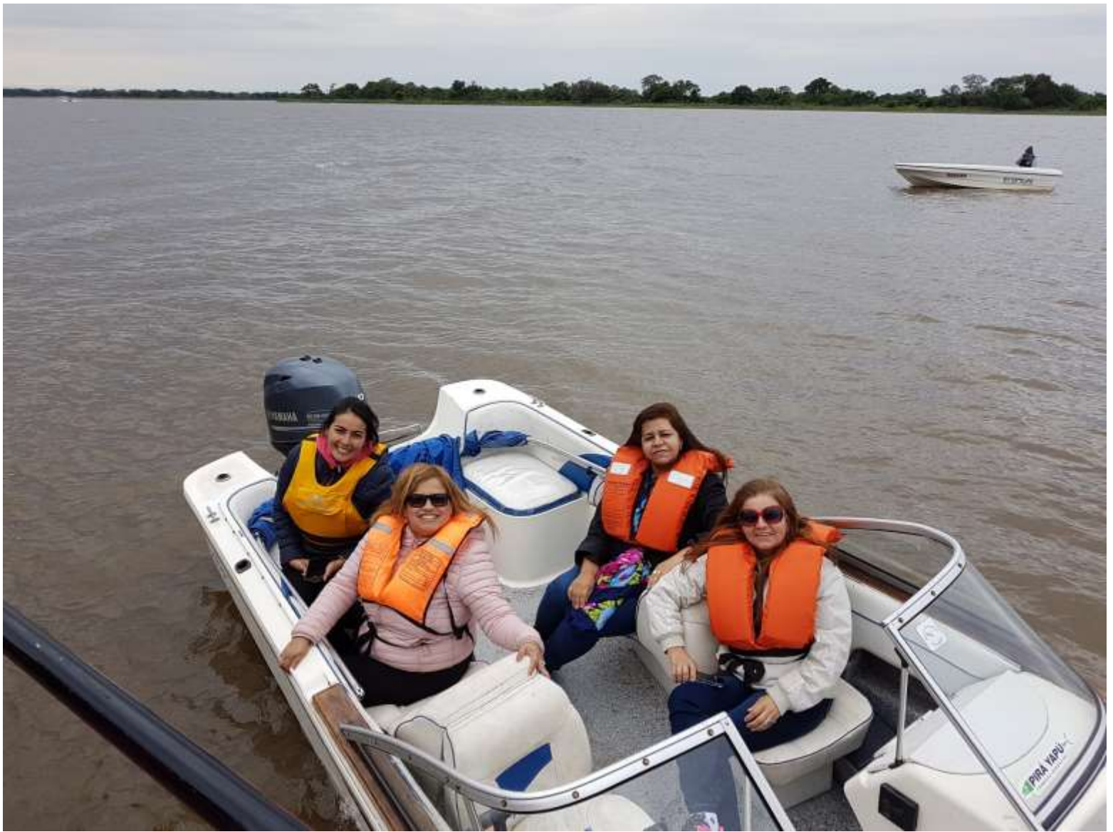
Navegación por la laguna Herradura