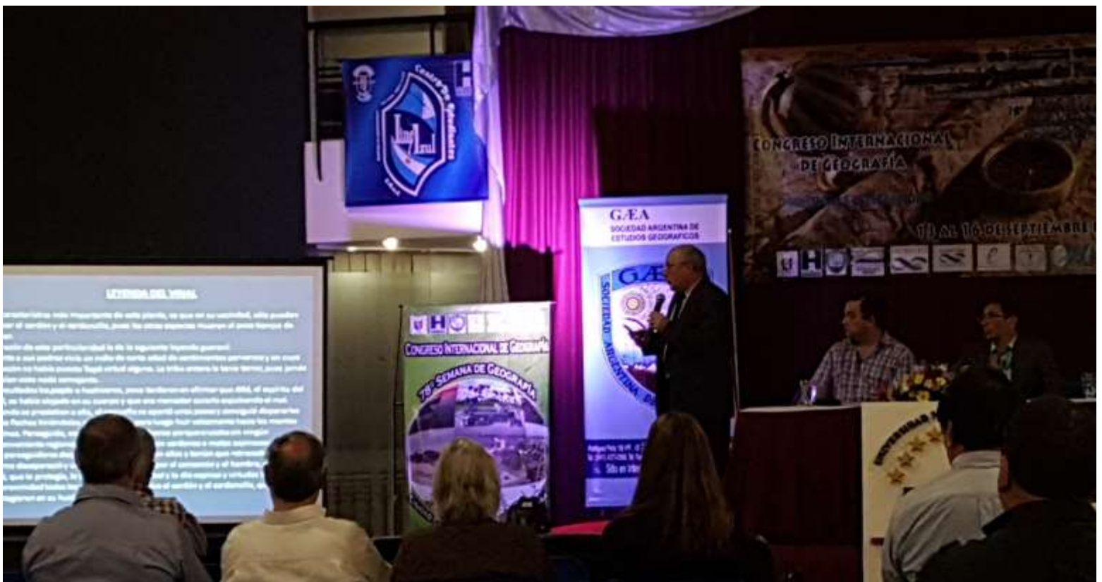
Exposición en las Comisiones temáticas